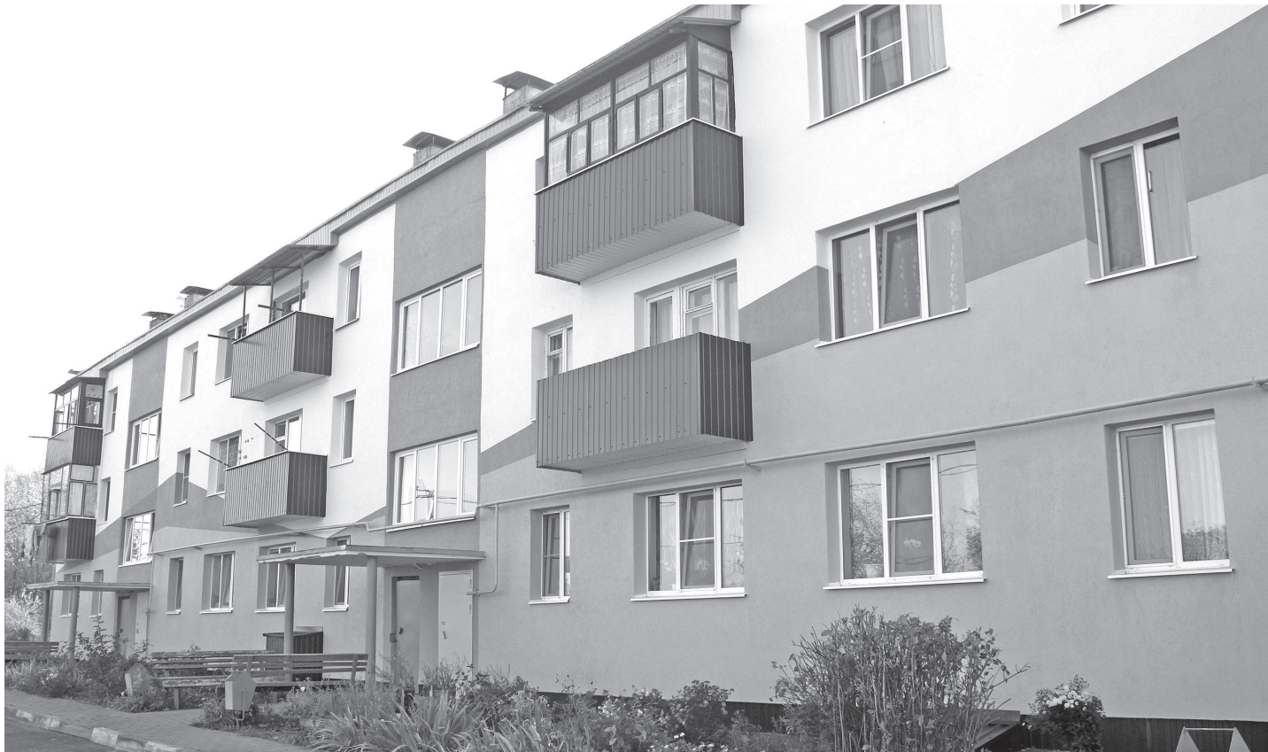
Дом №1а на ул. Новой в микрорайоне Салтыково